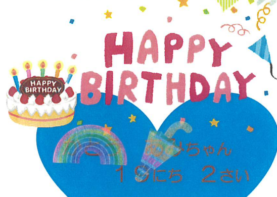
今月のお誕生日のお友だち