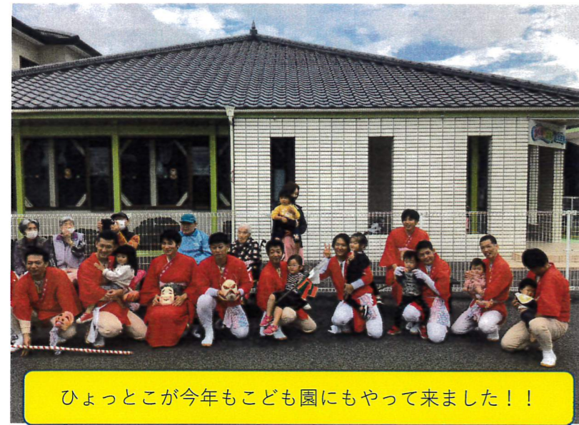
ひょっとこが今年もこども園にもやって来ました！！