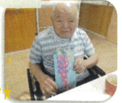
上手にできました。